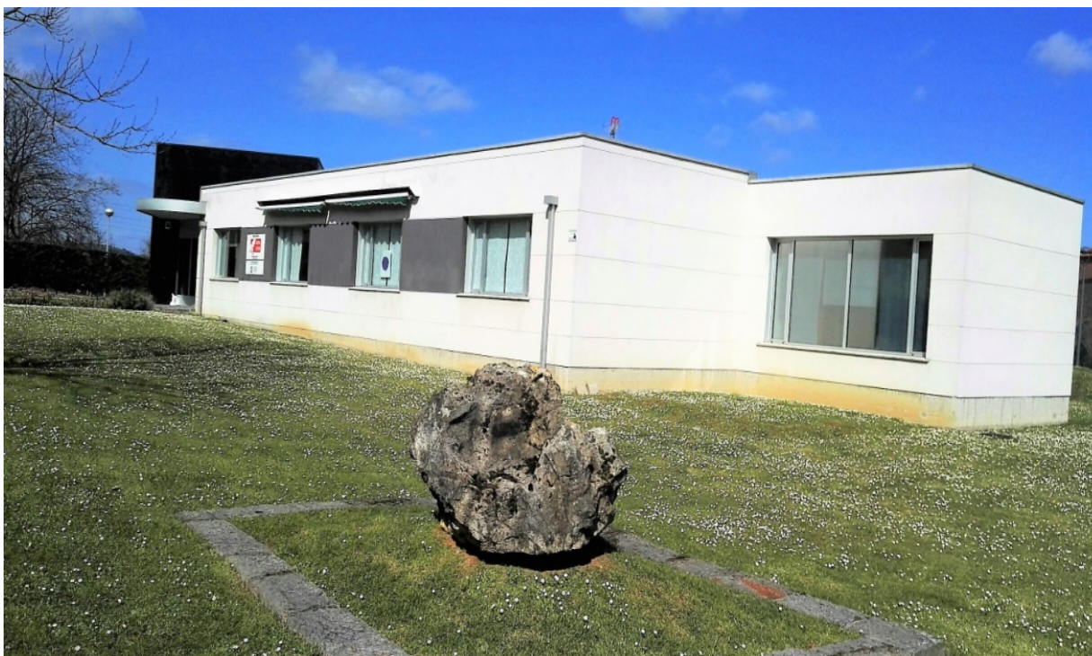
Cartera de Servicios – Centro de Dia Bizigura del Grupo Babesten